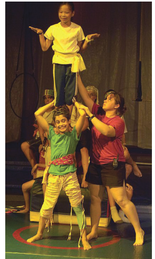
PHOTO : Développer ses habiletés et travailler en groupe pour atteindre un objectif : voilà deux des bienfaits qu'il est possible de retirer de la pratique des arts du cirque.

Pour en savoir plus : 514-768-5812 ou www.e-cirqueverdun.com